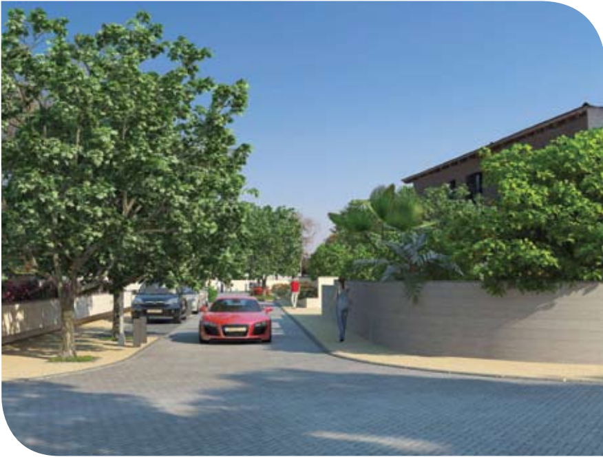
הדמיה, מראה סופי מתוכנן של רחוב התמר