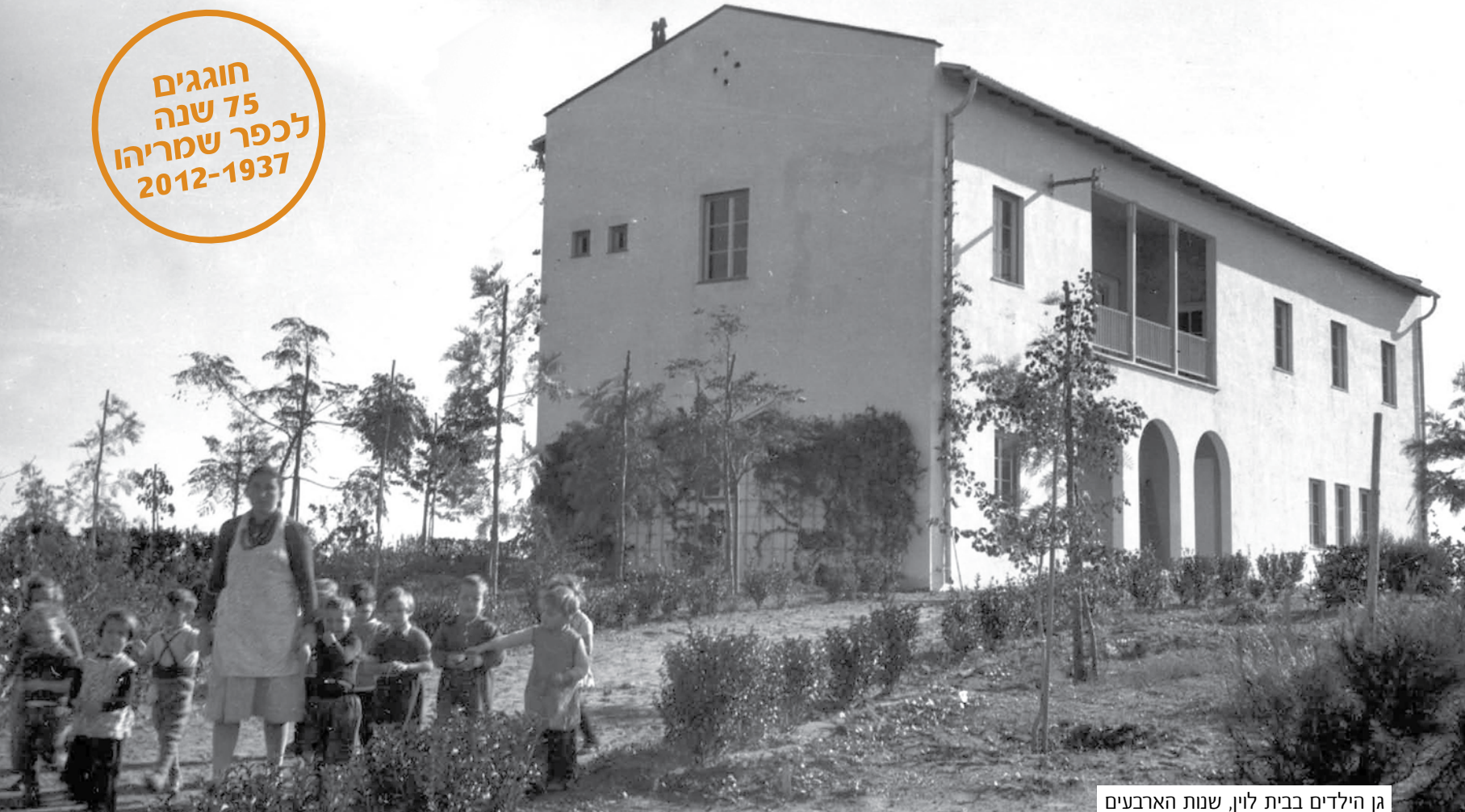
גן הילדים בבית לוי, שנות הארבעים