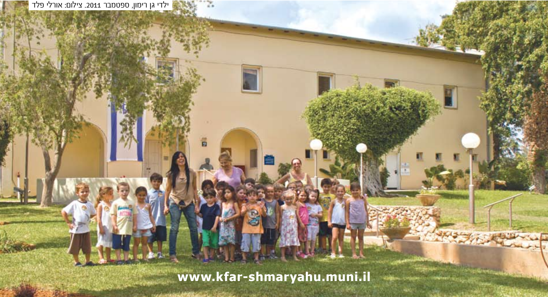
ילדי גן רימון, ספטמבר 2011.