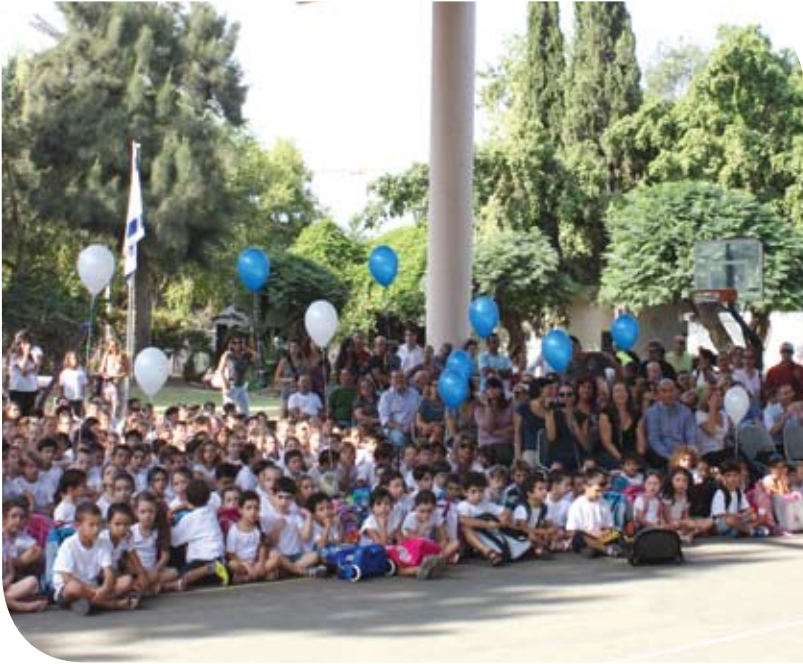
שלום כיתה א', 1 בספטמבר 2011