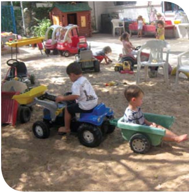
חצר המשחקים, גן דלית ואפרת