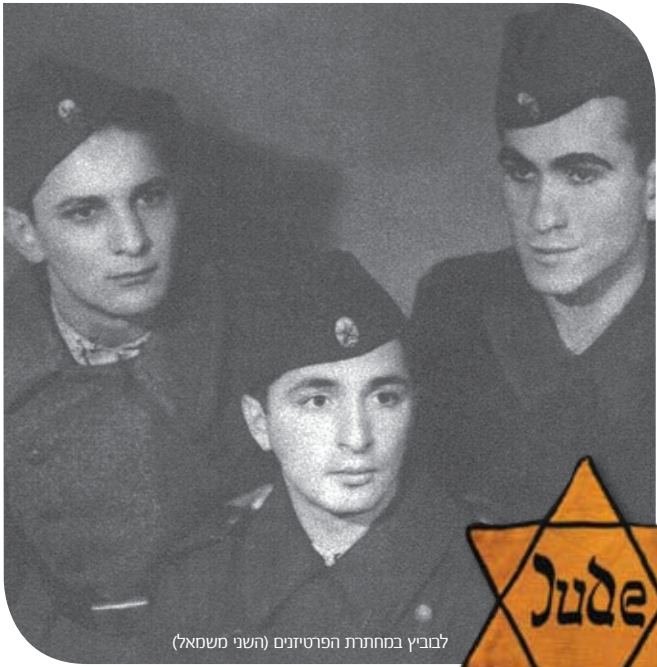
למביץ במחתרת הפרטיזנים (השני משמאל)