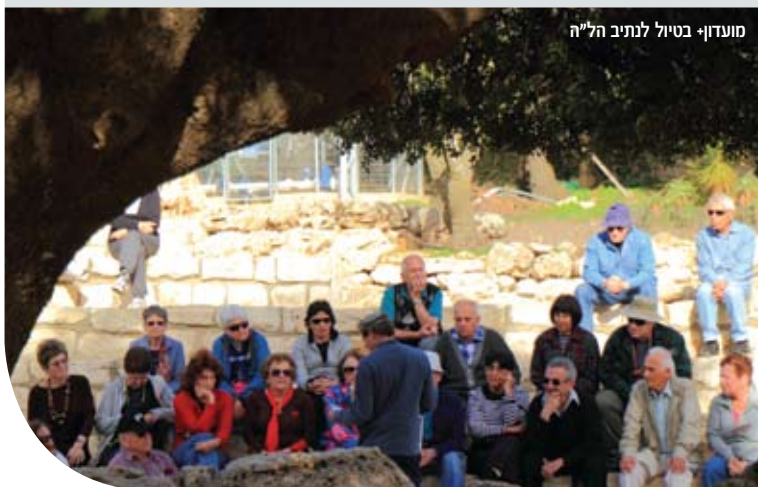
מועדון+ בטיול לנתיב ה"ה"