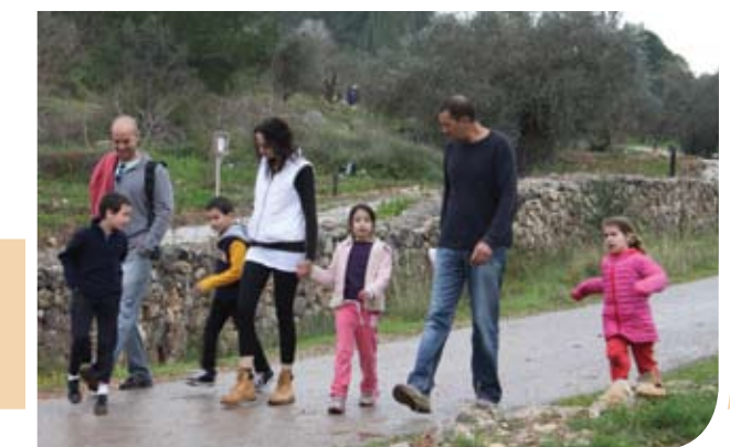
יום המשפחה בנאות קדומים

שאר ילדי ביה"ס טמנו פקעות פרחי בר באזור שביל החורב.