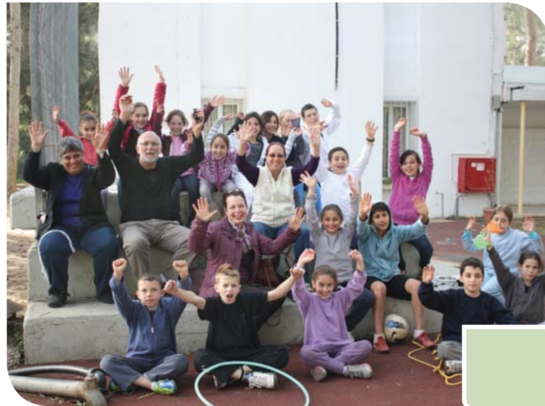
תלמידי מועצת התלמידים עם משתתפי תכנית "הקשר הרב דורי"

בפגישה הראשונה הילדים קיבלו את פנינו בהתרגשות גדולה, הם הכינו שולחן ובו המאכלים האהובים עליהם. לאחר ששיחקו כמה משחקי היכרות וכל ילד סיפר על המאכל שהביא, ישבנו ביחד, שוחחנו ואכלנו מהמטעמים.