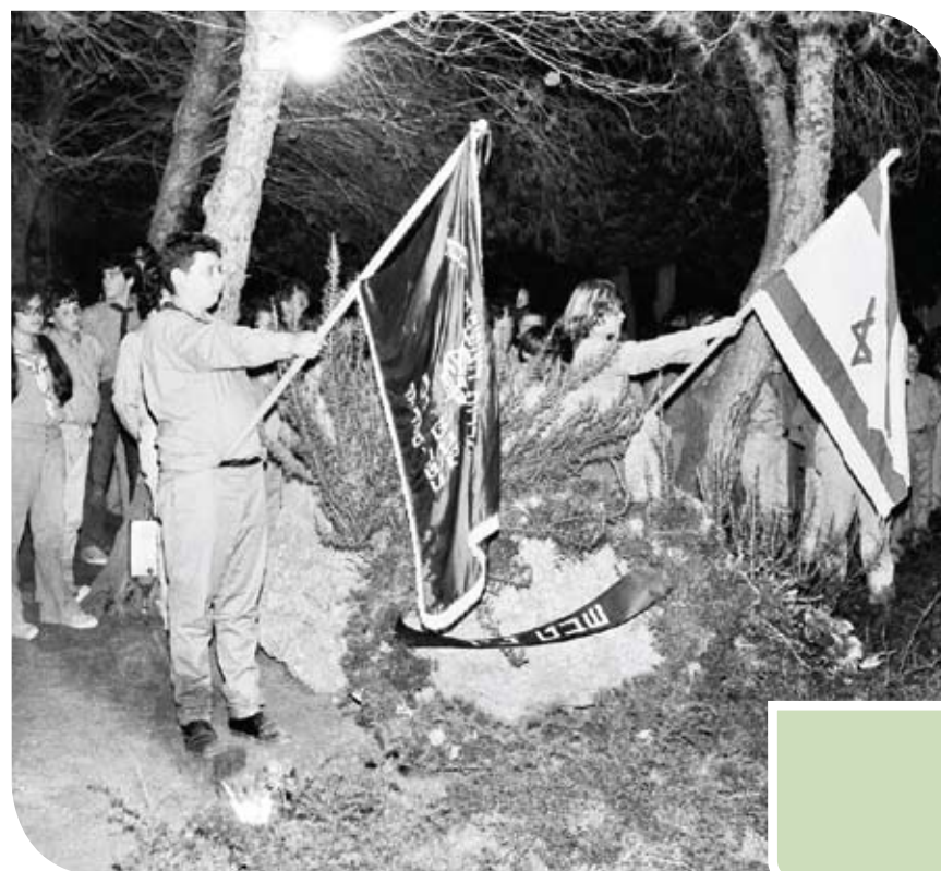
שמור הצופים ביום החינוך

הגעתי עם משפחתי לכפר שמריהו ב-1952, במסגרת יוזמה של בן גוריון לפיה אנשים העובדים בעיר, יטפחו משקים ויעסקו בחקלאות בשעותיהם הפנויות. כלומר יתרומו למדינה ולמשק פעמיים: פעם אחת במסגרות המקצועיות שלהם (אבא שלי היה מדען) ויטעו כל יום לעיר לעבודתם ובמקביל יטפחו משקי עזר בפריפריה החקלאית. בתמורה לעזיבת העיר קיבלו משק עזר. תנאי המחייה היו קשים ולכל בית הייתה עששית נפט אחת.