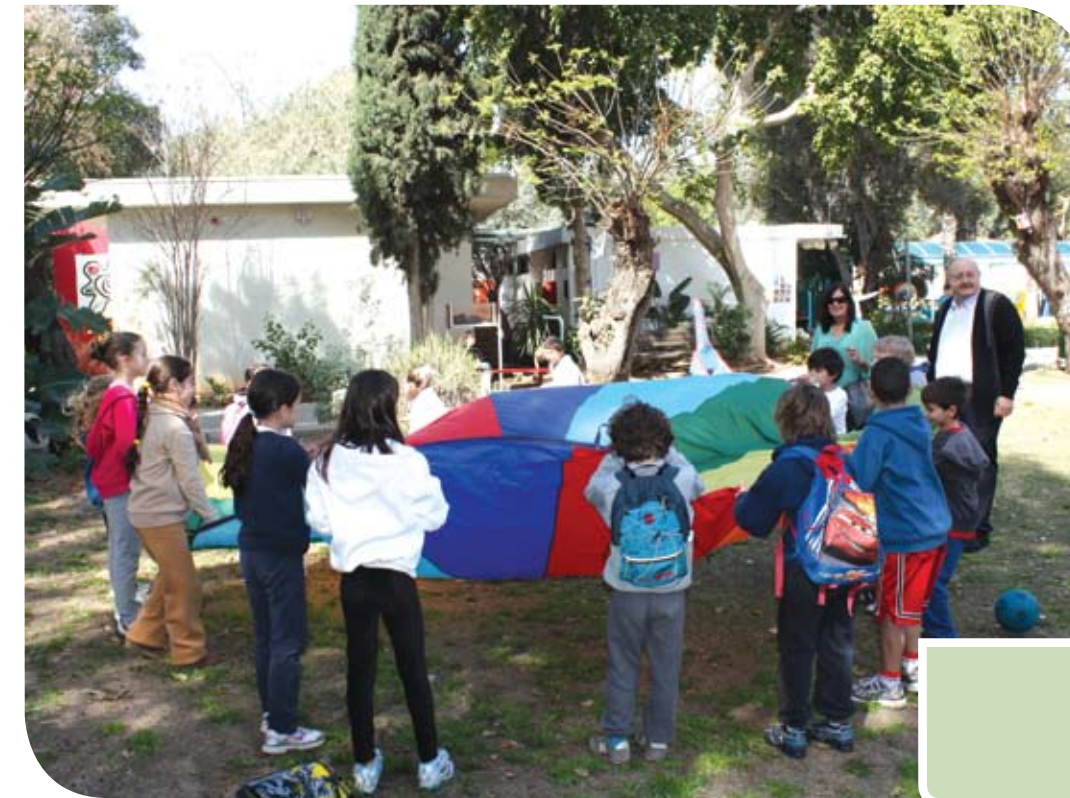
מארחים את ילדי בית ספר "ברנדיס"